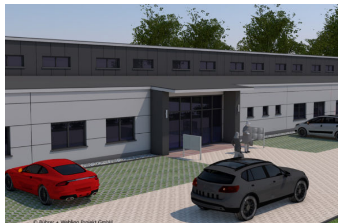
Neubau des Triple Z visualisiert 3