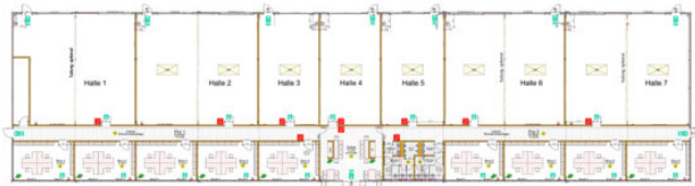
Grundriss Neubau Erdgeschoss