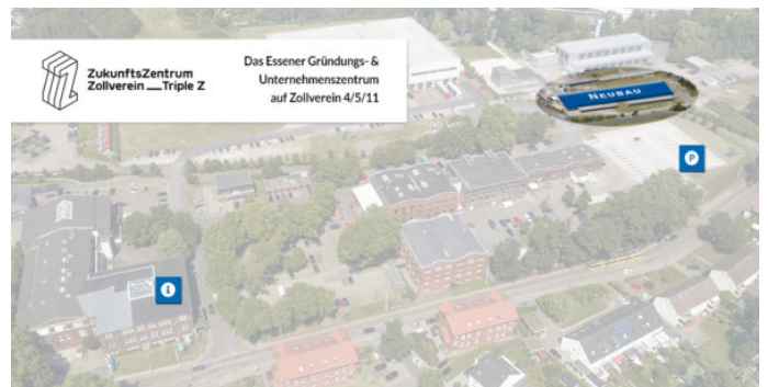
Neubau-Pläne: Lage auf dem Triple Z-Gelände