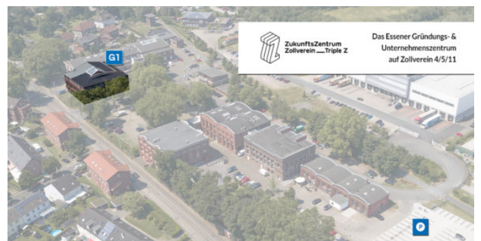
Lage auf dem Triple Z-Gelände Das Raumangebot befindet sich in Gebäude: