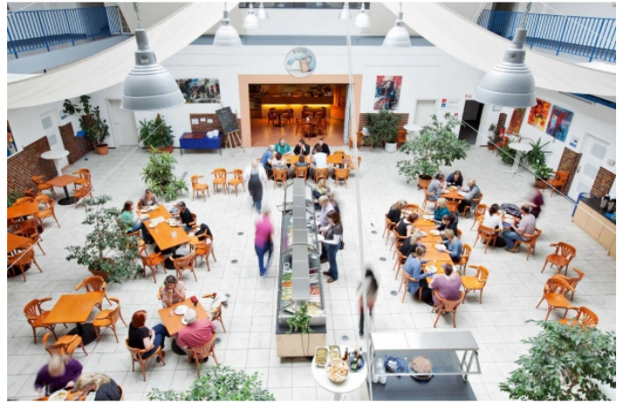
Lohnhalle mit Bistro