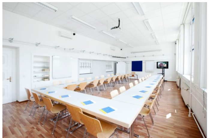
Konferenzraum 1 "Lohnbüro"