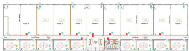
Grundriss Neubau Erdgeschoss