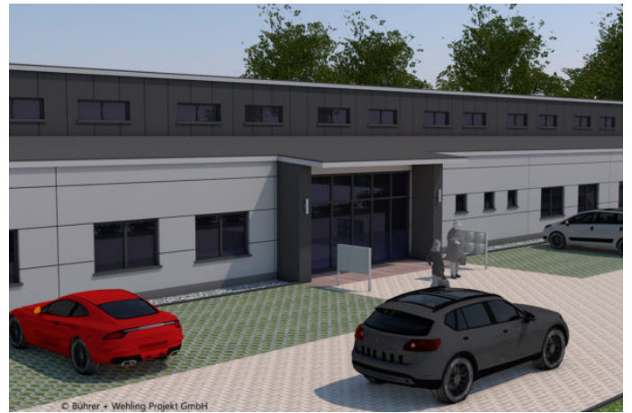
Neubau des Triple Z visualisiert 3