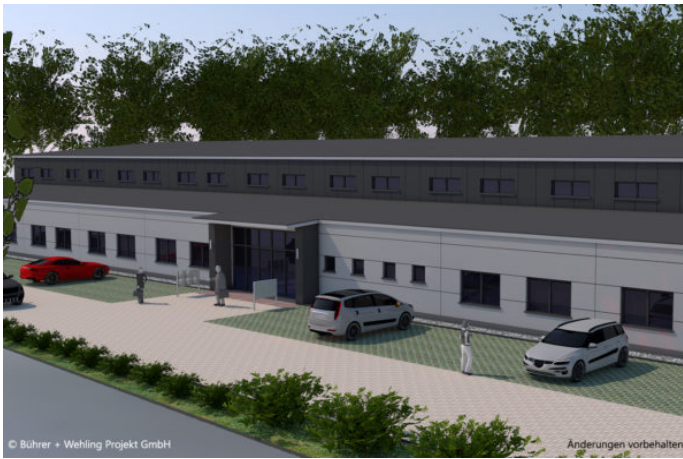
Neubau des Triple Z visualisiert