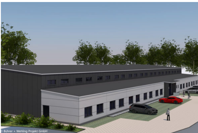
Neubau des Triple Z visualisiert 2