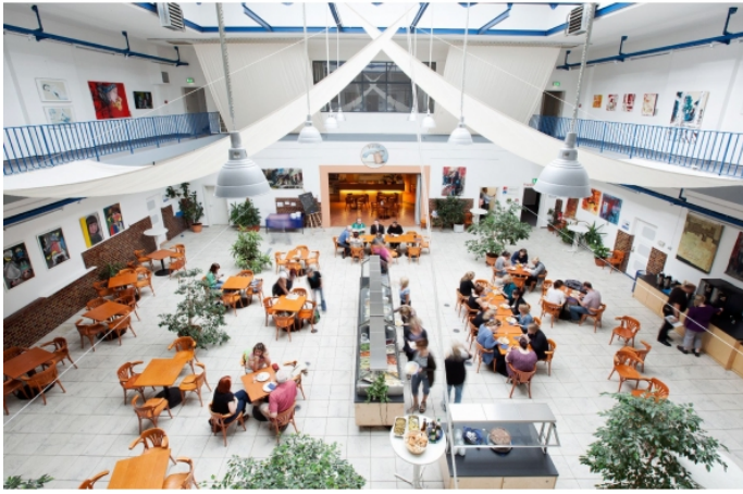
Lohnhalle mit Bistro