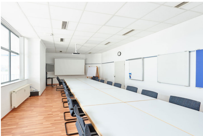
Konferenzraum 2 "Steigerbad"