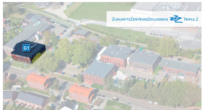
LAGE AUF DEM TRIPLE Z-GELÄNDE Das Unternehmen befindet sich in Gebäude: