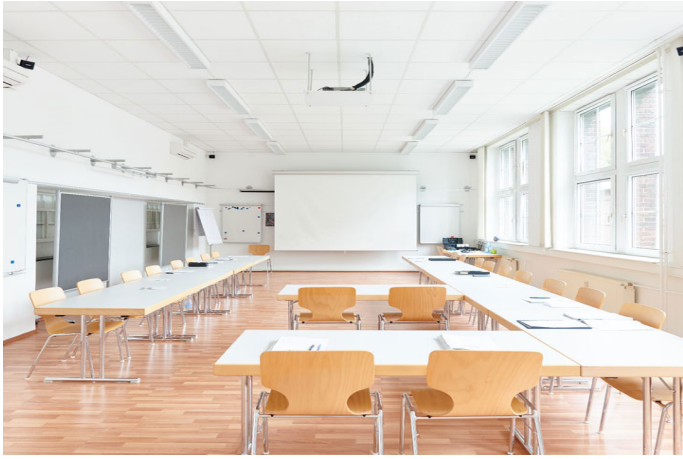
Konferenzraum 1 "Lohnbüro"