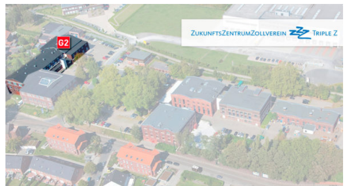
LAGE AUF DEM TRIPLE Z-GELÄNDE Das Unternehmen befindet sich in Gebäude: