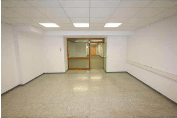
G2 UG 15+16_20131115_001