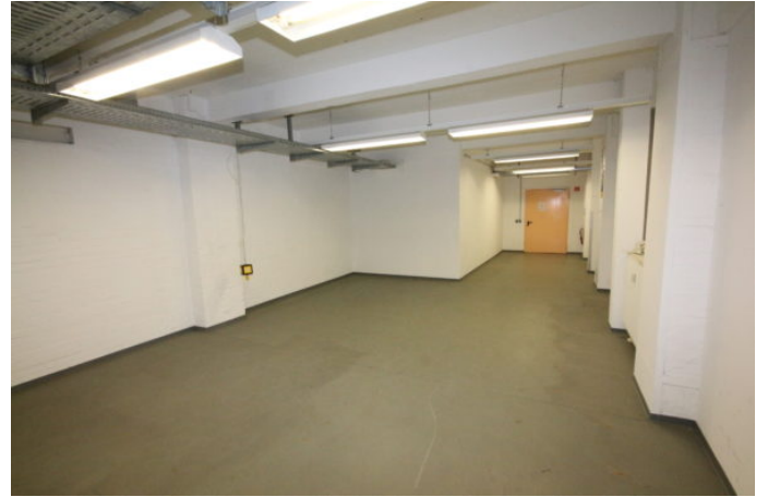
G2 UG 15+16_20131115_005